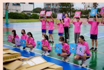
六年級 聰明防詐保安全