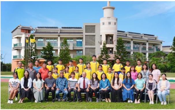
第 19 屆國小畢業生與教師合影