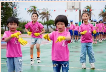
幼兒園 撒嬌我最行