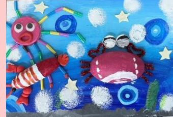
401 王宥蓉 海底世界