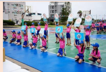
二年級 正確洗手·保護健康