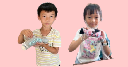
101 周秉澤/鄭香涵 香包