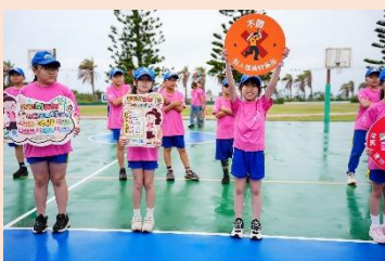
四年級 正確用藥報你知