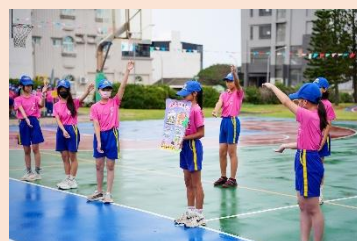
五年級 路口慢看停·行人優先