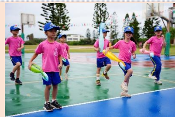
一年級 好好刷牙·笑容更燦爛