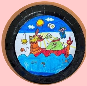
101 白亞樂 端午划龍舟