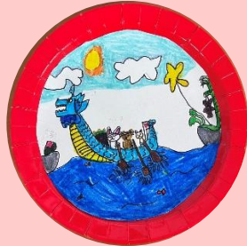
101 陳意霏 小動物划龍舟