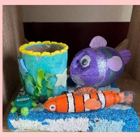
301 呂依萱 我的世界