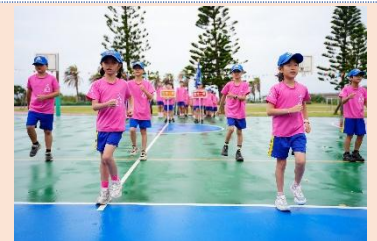
三年級 護眼小尖兵