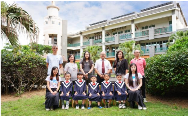
第 1 屆附設幼兒園與教師合影