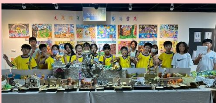
501 全班 立體雕塑