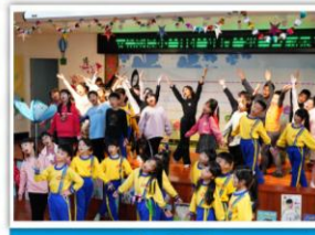
—— 合唱團 —— 東南亞歌謠