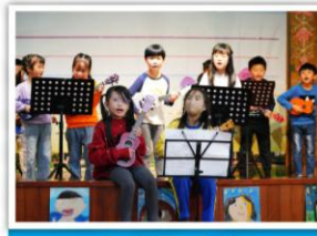
—— 烏克蘭麗社 —— 歡樂組曲