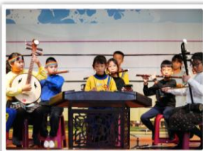
—— 國樂社 —— 絲竹樂組曲