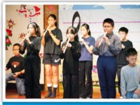
—— 六年級 —— 我們的 GOLDEN 時刻