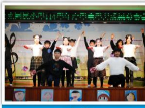
—— 五年級 —— THE WORLD IS YOURS