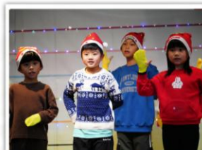
—— 二年級 —— 愛心樹遍人間