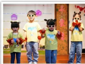
—— 幼兒園 —— 魔法寶貝