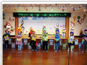
—— 一年級 —— 五線譜村的七彩小精靈