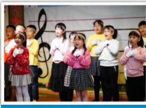
—— 四年級 —— MAKE YOU PROUD